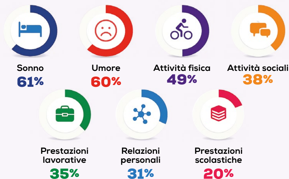
FIGURA 3 Baena-Cagnani et al. WAO -World Allergy Organization Journal 2015.

La Rinite Allergica ha un sensibile impatto sulla Qualità di Vita del paziente, in quanto questa malattia influisce su molte sfere del quotidiano dei pazienti, come riassunto nello studio di Baena-Cagnani et al. WAO -World Allergy Organization Journal 2015.